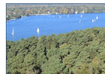
Blick vom Grunewaldturm