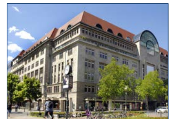
Kaufhaus des Westens (KaDeWe)