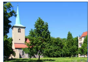
Allte Pfarrkirche Lichtenberg